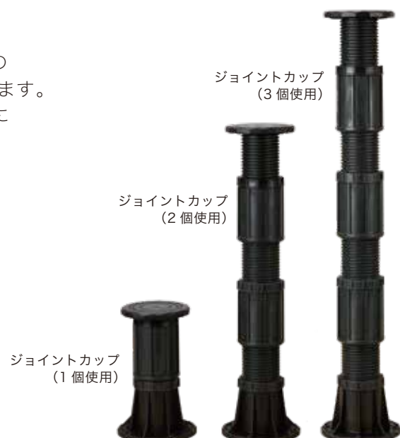
ジョイントカップ (3個使用)